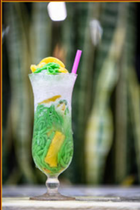
Bánh Lọt & Mít Cendol & Jackfruit 濱落和波蘿蜜