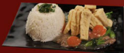
c. Xào Chay