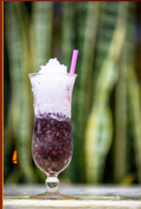
Đậu Đỏ Red Bean - 紅豆