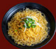
Mì Sợi Nhỏ (Nước) Thin Egg Noodle (SOUP) 細麵 (湯)