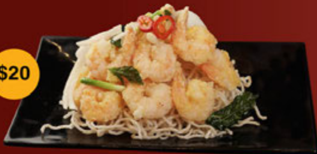
e. Tôm (Không Vỏ) Prawn (Skin off) - 虾 (无壳)