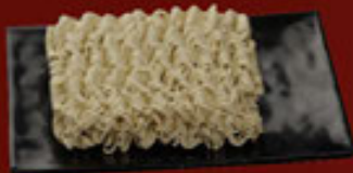
Mì Gói Instant Noodle 即食麵