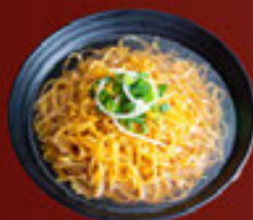
Mì Sợi Lớn (Nước) Thick Egg Noodle (SOUP) 粗麵 (湯)