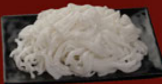
Bánh Phở Rice Noodle 河粉