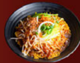
Mì Sợi Nhỏ (Khô) Thin Egg Noodle (DRY) 細麵 (乾)