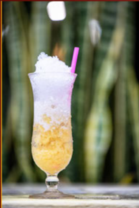
Đậu Xanh Mung Bean - 綠豆