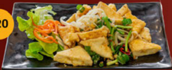
a. Đậu Hủ - Tofu - 豆腐