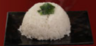
Chén Cơm Tẻ Bowl of Rice 01碗飯