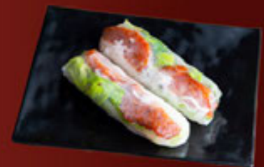
11. Nem Nướng (2 Cuốn) Pork Meat Ball (2pcs) 猪肉丸 (2pcs)