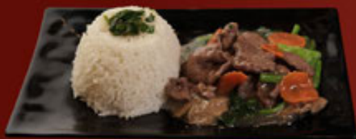
a. Bò và Rau Cải