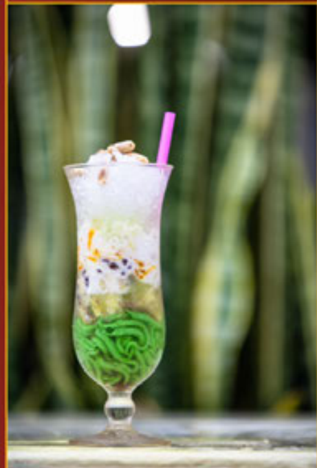
Ba Màu Three Color 三色