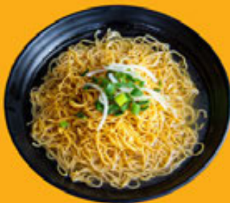
Mì Sợi Nhỏ Thin Egg Noodle 细蛋麵