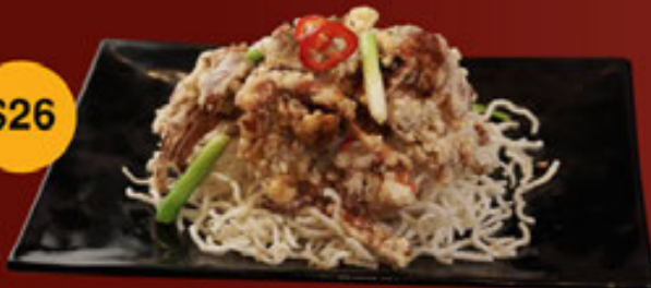
c. Cua Lột - Soft Shell Crab - 软壳蟹