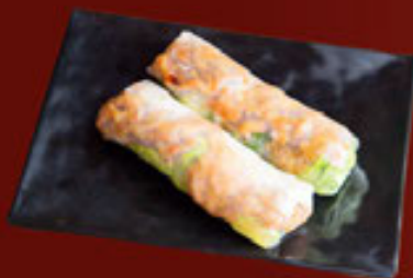
9. Thịt Nướng (2 Cuốn) Grilled Pork (2pcs) 烤猪肉 (2pcs)