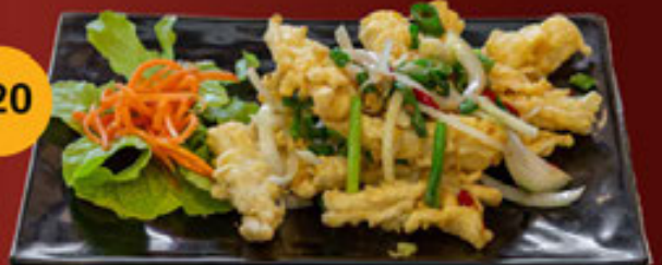
b. Mực - Calamari - 魷魚