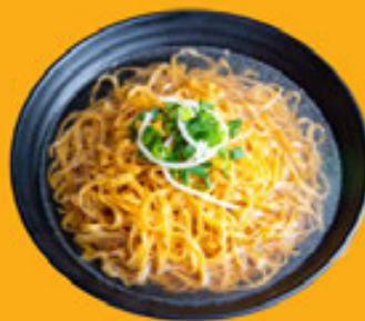
Mì Sợi Lớn Thick Egg Noodle 粗蛋麵