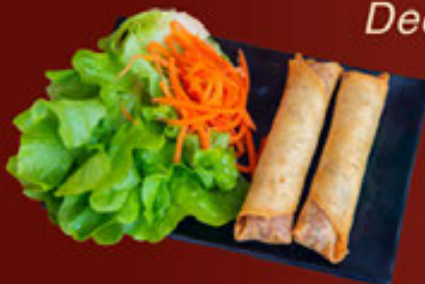
12. Chả Giò Thịt Heo (2pcs) Pork Meat (2pcs) 猪肉 (2pcs)