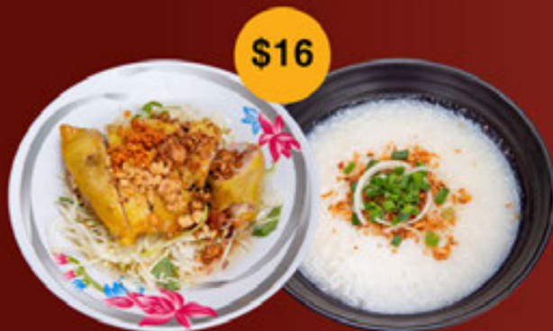
a. Gà Hải Nam (Có Xương/ Không Xương) Hainan Chicken Salad (Bone/ Boneless) 海南鸡沙拉 (有骨 / 没有骨)