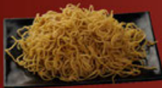
Mì Trứng (Sợi Nhỏ/Sợi Lớn) Thin Egg Noodle/Thick Egg Noodle 细蛋麵/粗蛋麵