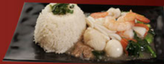
b. Đồ Biển và Rau Cải