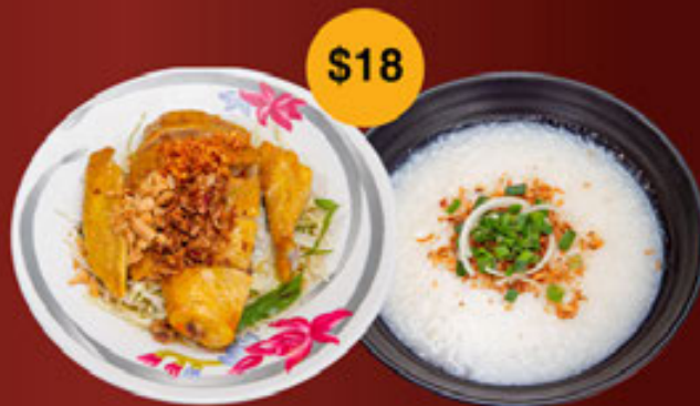
b. Gà Chạy Bộ (Có Xương/ Không Xương) Free Range Chicken Salad (Bone/ Boneless) 走地鸡沙拉 (有骨 / 没有骨)