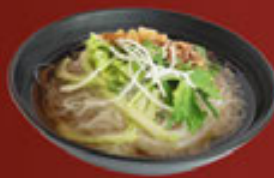
Hủ Tiếu Dai (Nước) Clear Noodle (SOUP) 粿條 (湯)