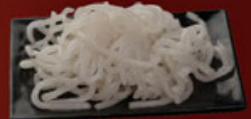
Bánh Canh Udon Noodle 烏冬粉