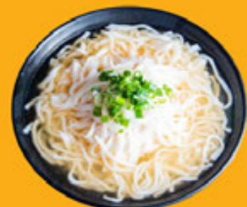
Bánh Phở Rice Noodle 河粉