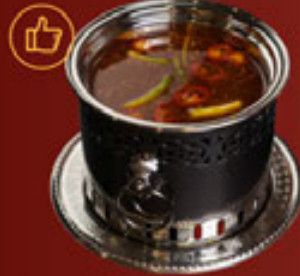
Soup Thai Tomyum Tomyum Soup 泰式酸湯