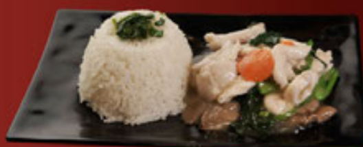
d. Gà và Rau Cải