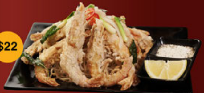
f. Tôm (Có Vỏ) Prawn (Skin on) - 虾 (有壳)