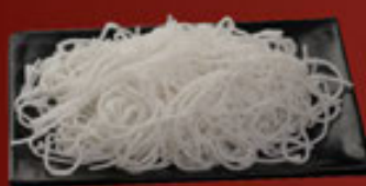
Bún Nhỏ Thin Vermicelli Noodle 细檬