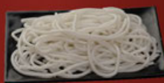
Bún Lớn Thick Vermicelli Noodle 粗檬