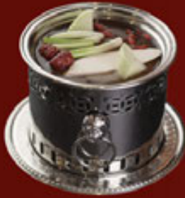
Soup Gà Chicken Soup 雞湯