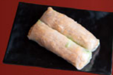
7. Bì (2 Cuốn) Shredded Pork (2pcs) 猪肉丝 (2pcs)