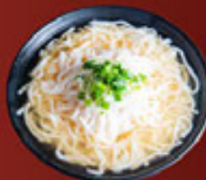
Bánh Phở (Nước) Rice Noodle (SOUP) 河粉 (湯)