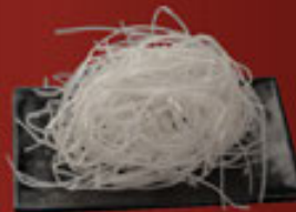
Hủ Tiếu Dại Clear Noodle 裸條