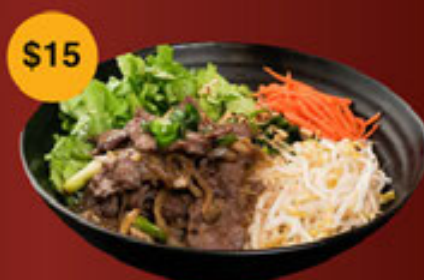
g. Bò Lúc Lắc Beef Cube w/ Black Pepper Sauce 牛柳粒