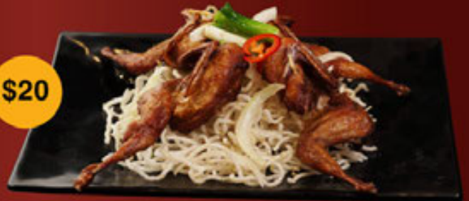
d. Chim Cút - Quails - 鹌鹑