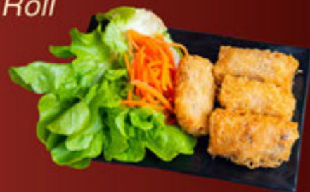
13. Chả Giò Rế Tôm Cua (4pcs) Crab & Shrimp (4pcs) 蝦和螃蟹 (4pcs)