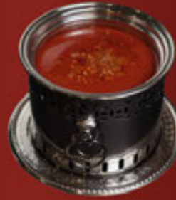
Soup Laksa Laksa Soup Laksa 湯