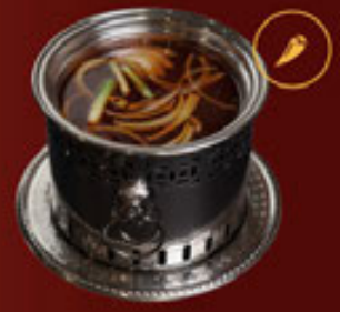
Soup Sate Sate Soup 沙爹湯